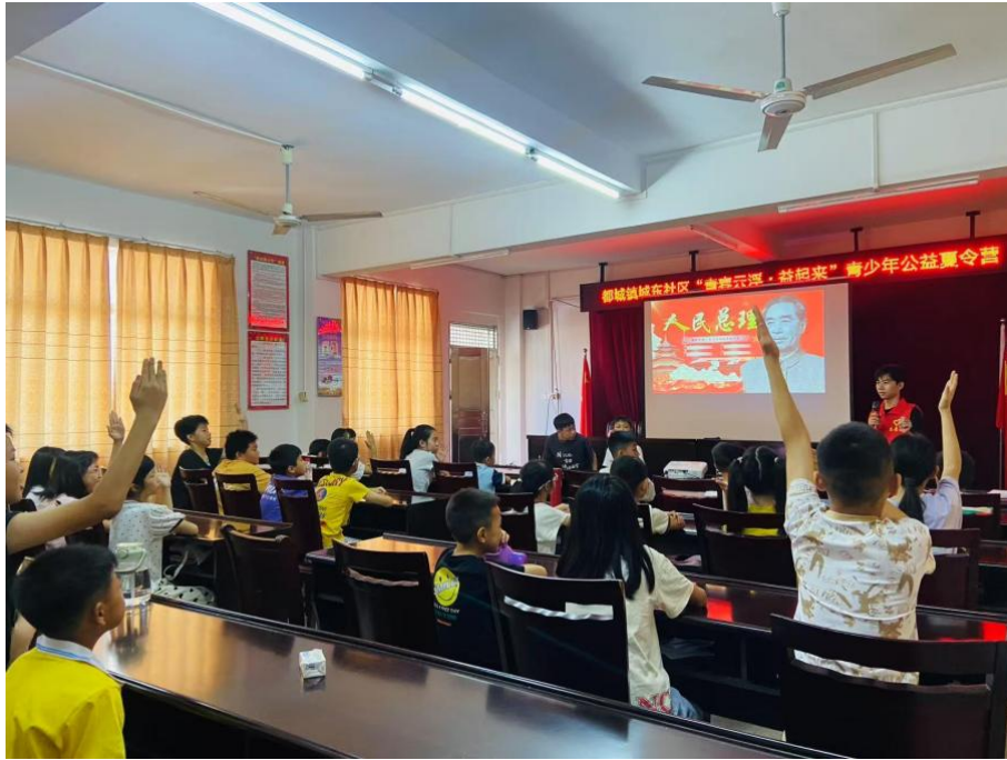
图 3.3.2-2 “智教乡行实践队”课堂现场