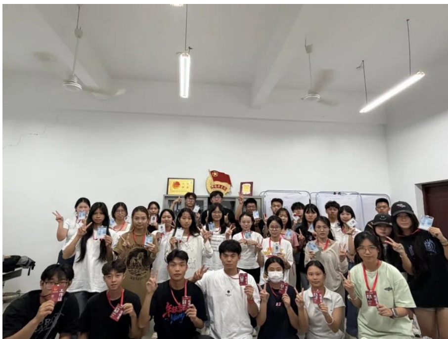
图 2.4-1 “小酒特训营”破冰与校园探索活动

从新生踏入校园第一步起，校团委便协同各方，构建全覆盖的关怀体系。通过精心组织迎新志愿者动员与培训，确保迎新工作高效有序，给新生留下美好的第一印象。校领导亲自率队深入新生宿舍走访慰问，面对面倾听“新”声，及时解决实际困难，传递学校的殷切关怀。举办“庆国庆迎新晚会”、社团操场快闪等活动，以艺术和青春活力欢迎新同学，快速营造“家”的温馨感。开展“小酒特训营”破冰与校园探索活动（见图 2.4-1），帮助新生快速融入集体、熟悉环境，消解陌生与焦虑。这些举措从情感层面切入，有效提升了新生及其家庭对学校的认同感和信任度。