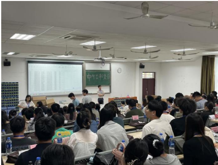
图 3.6-1 学校承接社会考试考务会现场

直属机构考试录用公务员笔试等各类考务工作 10 次，服务考生超 58318 人次。（见图 3.6-1）