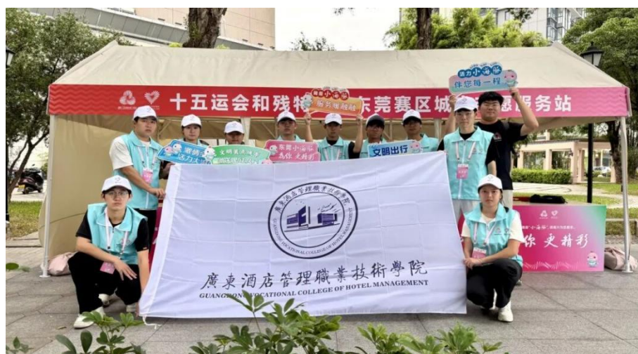
图 2.1-3 学校青年志愿者助力十五全运会活动志愿服务活动

量发展路径；积极动员青年志愿者助力十五届全运会等大型赛会（见图 2.1-3），展现广酒青年的奉献担当。另一方面，深入实施“百千万工程”突击队行动与暑期“三下乡”社会实践，组建“青禾”“燎原”等多支突击队，深入社区基层，开展医疗辅助、禁毒宣传、红色文化调研等服务，让学生在广阔的社会课堂中“受教育、长才干、作贡献”（见图 2.1-4）。无偿献血活动的成功举办，更是体现了学子们奉献社会、珍爱生命的大爱精神。这些实践行动将立德树人从课堂延伸至社会，有效锤炼了学生的社会责任感和实践能力。