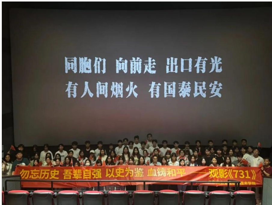
图 2.1-1 组织学生观看爱国主义电影