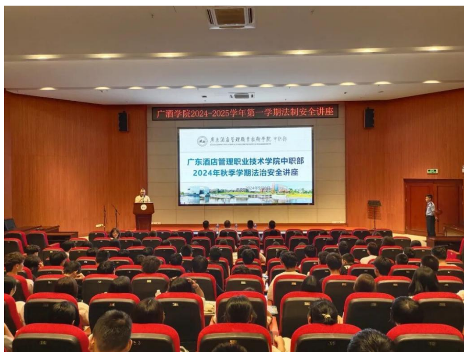
图 7.2-1 学校召开 2024-2025 学年第一学期法治安全讲座

出的位置。依据规章制度“废、改、立”的动态管理原则，对全校现行管理制度进行了一次全面、系统的梳理与修订，并在此基础上编印了《广东酒店管理职业技术学院管理制度汇编》。该汇编包含近 170 条制度，内容全面，系统收录了学校在党的建设、行政管理、教育教学、科学研究、学生工作、后勤保障等各个领域的规章制度，形成了有机统一的制度集合，为学校各项工作的开展提供了清晰、权威的依据，有力地推动了以章程为核心的现代大学制度体系的完善与落实。此外，学校大力营造全员学法、守法、用法的校园氛围，法治教育形式丰富多样，将法律法规有机融入教职工大会、新生教育及思想政治理论课，使法治精神浸润校园文化，创造了良好的法治校园环境。（见图 7.2-1）