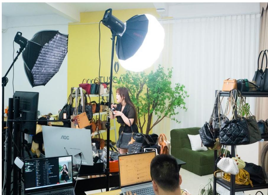
图 6.4.3-1 直播团队线上直播场景

2025 年，学生获省级及以上以上技能竞赛奖项 6 项，毕业生就业率达 98%，涌现出“皮具直播达人”“跨境电商新秀”等突出先进个人及团队。