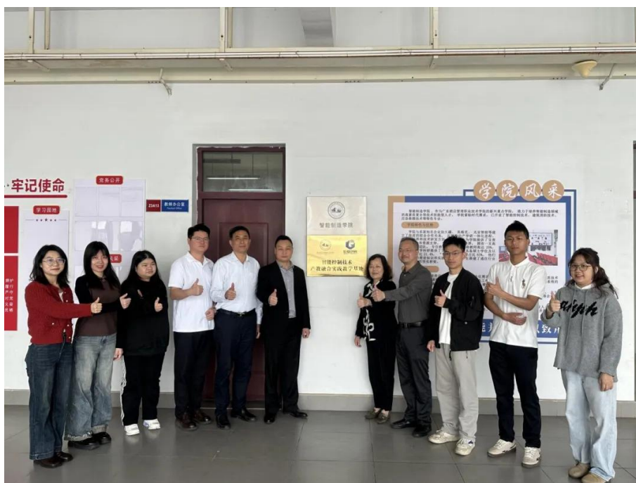
图 6.4.1-1 学校智能制造学院与广东巨基创新科技有限公司合作洽谈

业学院”，并重点围绕蓬勃发展的低空经济领域（如无人机物流、智慧城市空中交通），联合开设“智能控制技术订单班”。该订单班构建“理论+项目实战”课程体系，由企业导师与校内教师共同指导，学生可深度参与企业真实技术项目。企业还提供专项奖学金、实习优先录用等激励，旨在实现从校园到职场核心岗位的“零距离”衔接，为智能制造与低空经济产业精准培养“懂技术、能创新、善应用”的高素质技能人才。