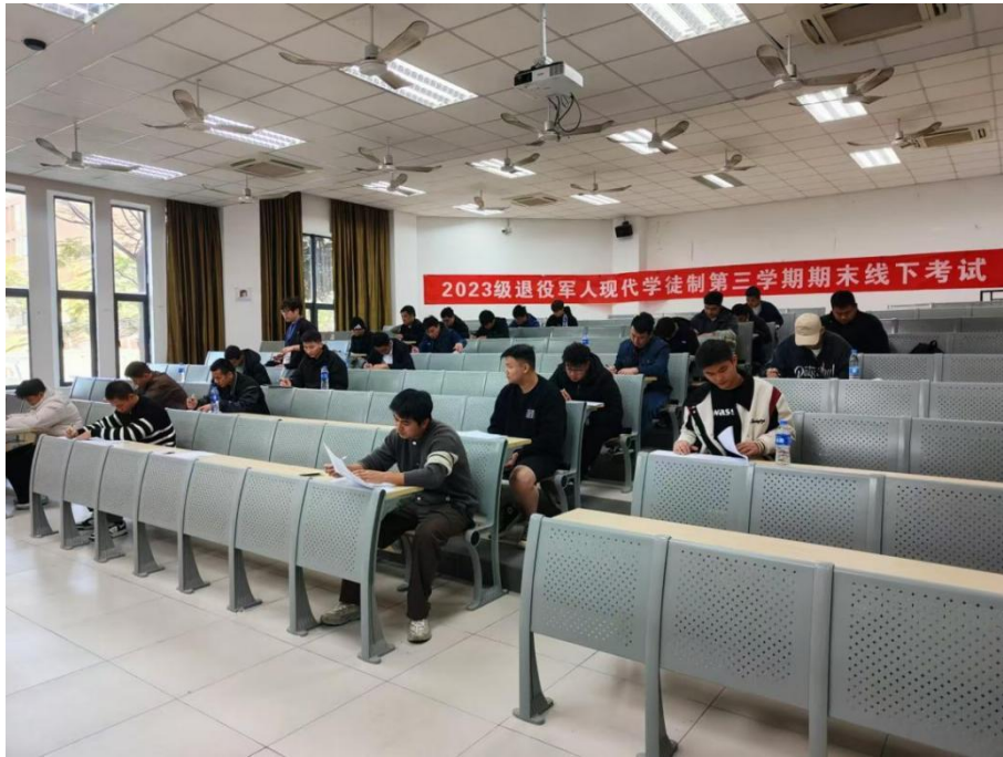
图 6.2-1 2023 级退役军人现代学徒制第 3 学期期末考试

高度重视，严格依据人才培养方案，由二级学院资深教师负责课程命题，继续教育学院教师承担监考任务，考后安排专人开展集中评分工作，全流程严把命题、监考、评分等关键环节，既彰显了对退役军人学生的责任担当，也充分体现了项目工学交替的灵活办学优势。