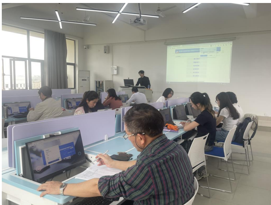
图 6.4.2-1 企业高管与专任教师一起探讨会计专业课程建设

依托 1000 平米实训基地，开发 5 项实战项目，引入专业软件承接业务；组建“经理+师傅”双导师团队混编授课，实施多元考核（见图 6.4.2-1）。改革后，学生获全国职业院校大数据财务分析竞赛一、二等奖，专业就业率 98.1%，35.6% 毕业生入职行业头部企业，为高职会计专业改革提供可复制样本。