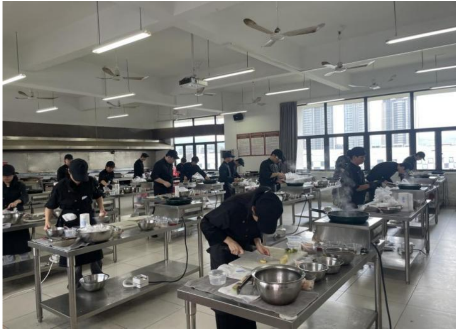
图 3.6-2 学校开展职业技能培训