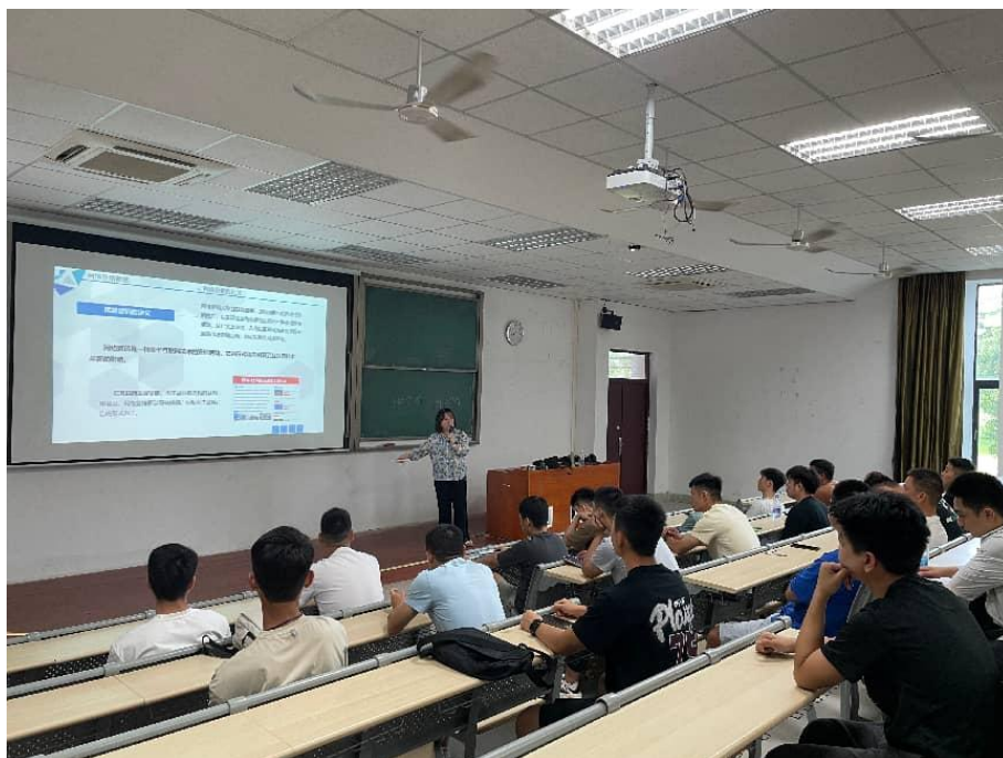
图 6.2-1 2024 级退役军人现代学徒制电子商务第 2 学期线下授课

期末考试环节：6 月 29 日，期末考试规范有序进行。上午 11 时，《毛泽东思想和中国特色社会主义理论体系概论》科目准时开考，考生按要求完成签到，考试全程启用录像监控，保障考核公平公正；下午，各专业分别开展对应科目考核，电子商务专业考核《市场调研》，工商企业管理专业考核《管理艺术与实务 1》。考场上，学生自觉遵守考场规则，沉着应考，展现了良好的考风考纪与退役军人的优良作风。