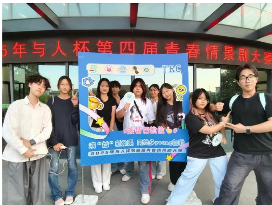
图 2.4-2 学校戏剧社参加东莞市 2025 年与人杯第四届青春情景剧大赛

校团委大力支持学生社团建设，将其作为拓展学生综合素质、丰富课余生活的关键载体。各类社团活动精彩纷呈：音乐协会、歌唱者联盟、街舞社等在晚会、快闪中尽显才华；无人机社团首次出征全国顶级赛事即斩获一等奖，彰显科技创新实力；龙狮社、英歌舞社、书法社等传统文化社团在校内外大放异彩，成为校园文化名片；岐黄康驿社等专业社团积极“走出去”学习前沿知识；2025年与人杯第四届青春情景剧大赛，学校星梦戏剧社与各高校剧社同台交流（见图 2.4-2），以戏剧为桥，收获满满。校团委通过举办社团文化节、展演、竞赛、外出交流等多种形式，为学生提供了发展兴趣爱好、提升专业技能、锻炼组织协调能力的多元平台，极大地满足了学生个性化、多样化的成长需求，使校园生活充满活力与色彩。