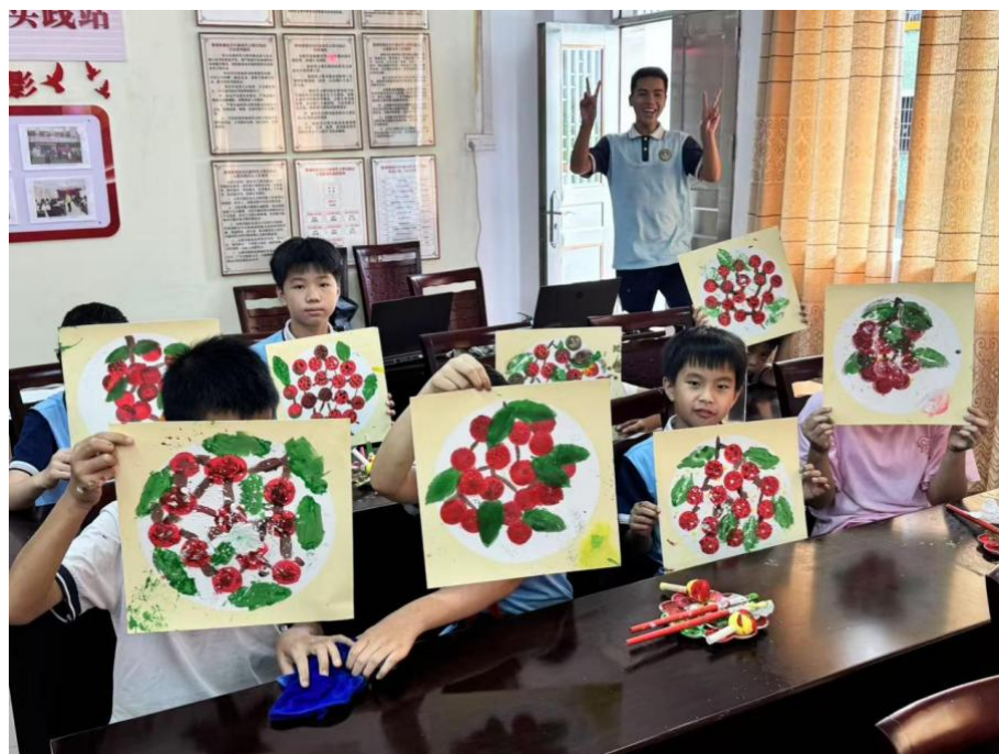
图 3.3.2-1 “智教乡行实践队”课堂现场

实践队共开展 8 场主题课程，包括趣味科学实验、AI 技术体验、青少年安全教育、心理健康课程等（见图 3.3.2-1），累计吸引了 50 人次参与。此外，团队还组织了 1 次参观郁南县科协科普展厅的活动，进一步拓宽孩子的科学视野。