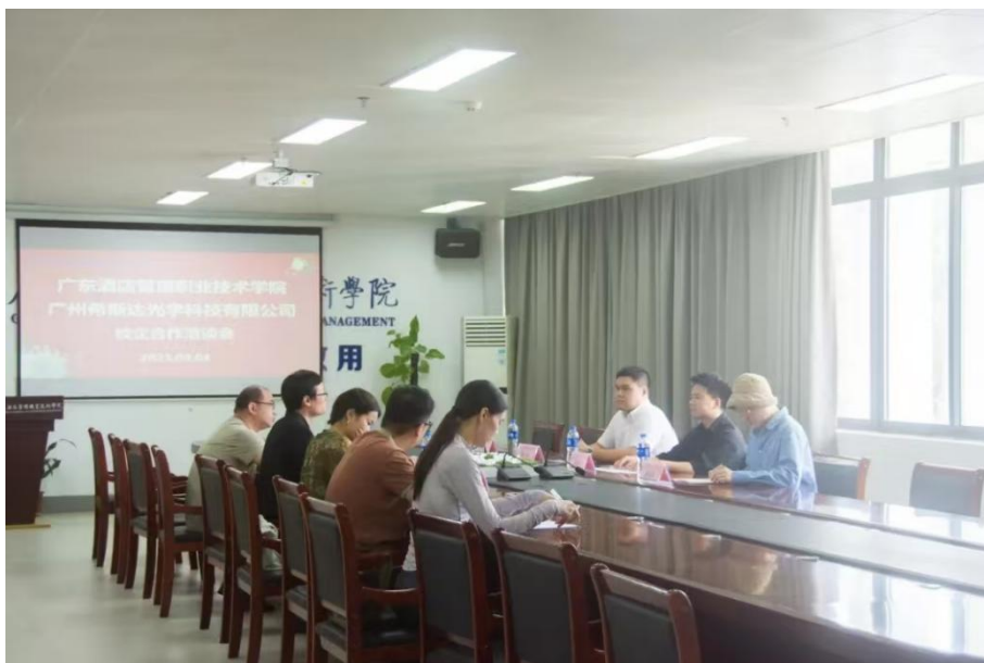
图 5.2-1 学校与企业进行合作洽谈

下一步，学校将基于前期调研成果，精准筛选合作对象，细化合作方案，推动合作办学项目落地见效，持续提升人才培养质量，为地方经济社会发展提供更有力的人才支撑。