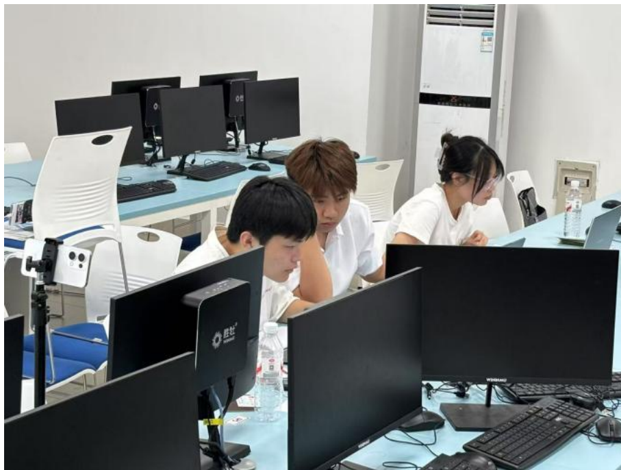
图 2.2.5-2 参赛团队在备赛教室进行系统测试演练