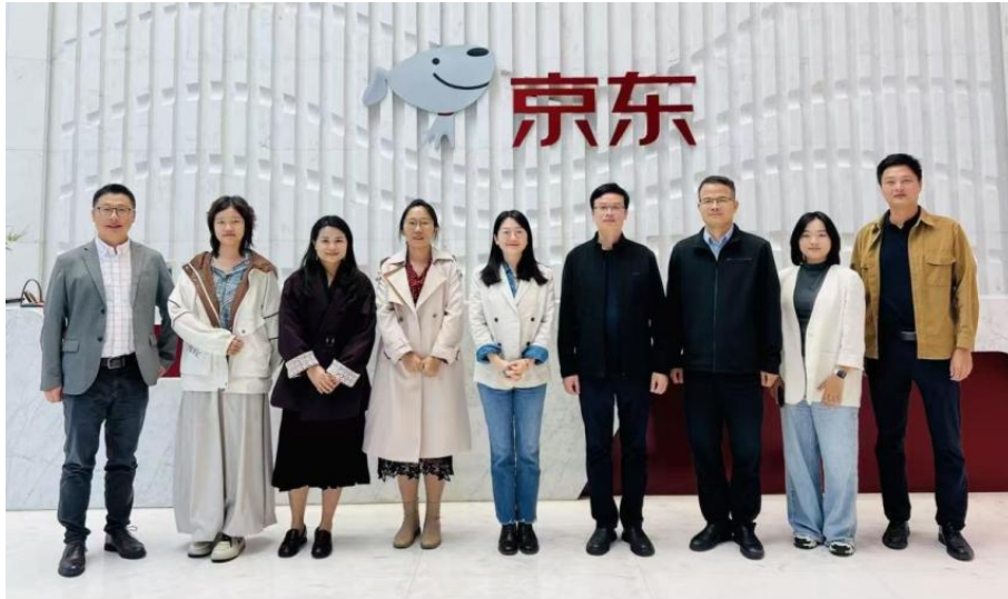
图 6.1-1 校企共建“数字财贸产业学院”合作洽谈

精准提升学生在电商、物流等领域的职业技能与就业竞争力。3、模式创新：此次合作旨在整合京东的产业资源与学校的教育优势，共同探索协同育人新路径，是学校打造高水平、特色化产业学院，服务数字经济发展的关键实践。