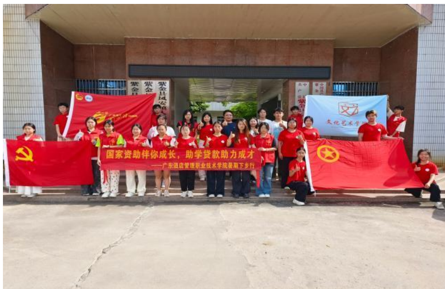
图 3.3.1-1 “百千万工程服务队”合影

方面，“艺启振兴青绘山海突击队”选取两村打造乡村美学示范点，以“一村一主题”墙绘融入历史民俗（见图 3.3.1-1），提升村落文化内涵与辨识度，吸引研学游客。产业赋能上，开发三类文创产品，结合墙绘元素与乡村特色制成明信片等文创品（见图 3.3.1-2），线上线下销售助农增收；设计文旅路线串联景观与景点，拓展文旅市场。青年成长层面，孵化乡村美育志愿团队，提升学生专业技能与社会责任感，总结“艺术设计+公共服务+文旅开发”标准化流程供借鉴。