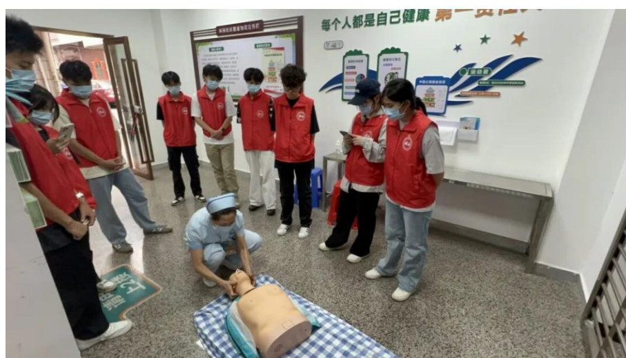
图 2.1-4 厚街环冈社区卫生服务站开展医疗辅助教学