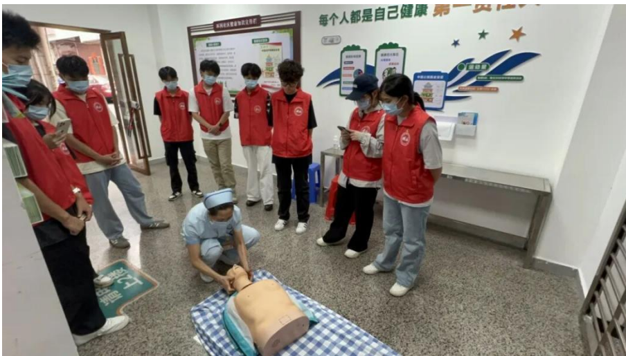
图 3.4-2 环冈社区卫生服务站护士长开展心肺复苏教学