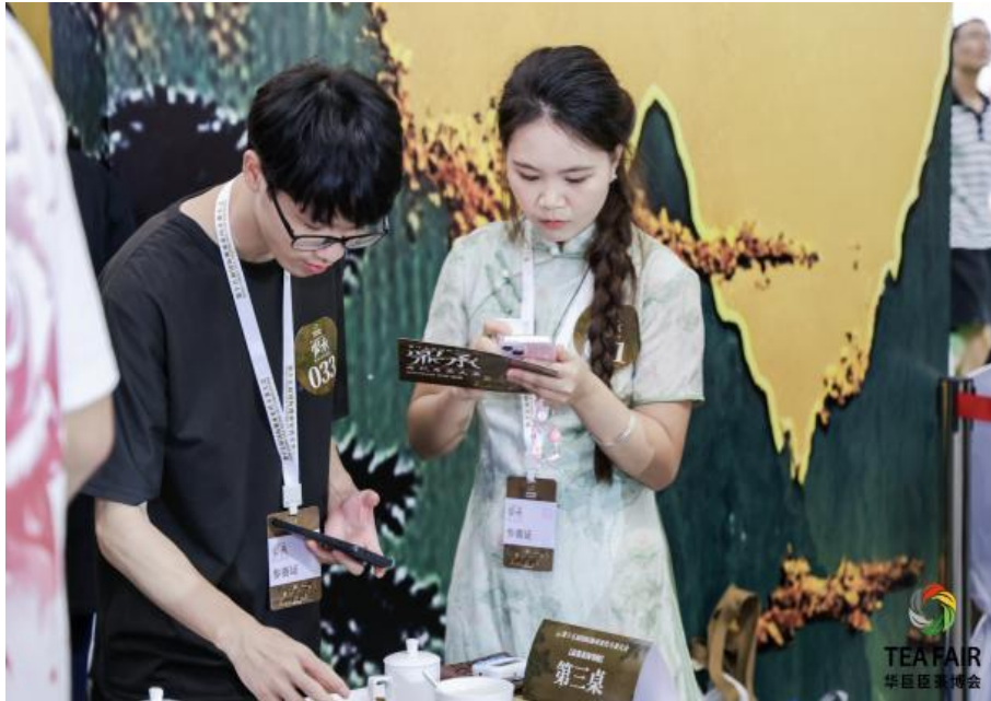
图 4.2-1 全国第十六届宋代斗茶大会比赛