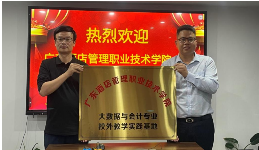
图 6.3-1 学校与广东大掌柜财税管理有限公司授牌仪式