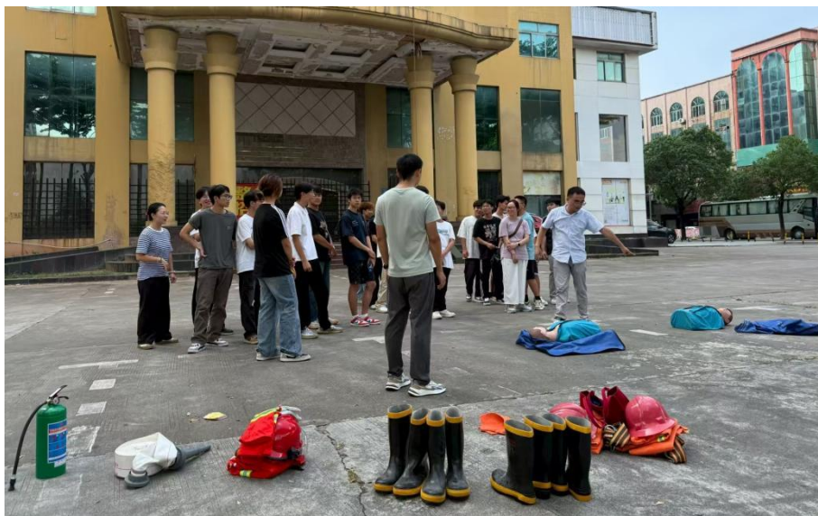
图 2.2.3-1 实训师生在实训酒店外开展集中授课实训工作场景(1)

为弥补课堂实操短板、丰富专业实践，建筑消防和应急救援技术专业以“兴趣引领实践，技能对接岗位”为核心，组织学生成立兴趣小组，依托珊瑚酒店实训基地开展常态化场景化实训（见图 2.2.3-1、图 2.2.3-2）。结合酒店建筑结构与应急需求，制定分层实训方案，设计消防设施操作等阶梯式训练内容并规范实训场景布置。实训采用“现场精讲+实操演练+方案研讨”模式，先以酒店外部为载体讲解高层火灾防控等知识，再指导学生实操消防栓、灭火器等设施；夯实基础后开展场景化模拟，学生分组扮演不同角色，完成火灾处置全流程操作。该模式显著提升学生学习热情，推动从“被动接受”到“主动探索”的转变，有效巩固专业知识，提升实操与团队协作能力，为学生投身相关行业奠定坚实基础。