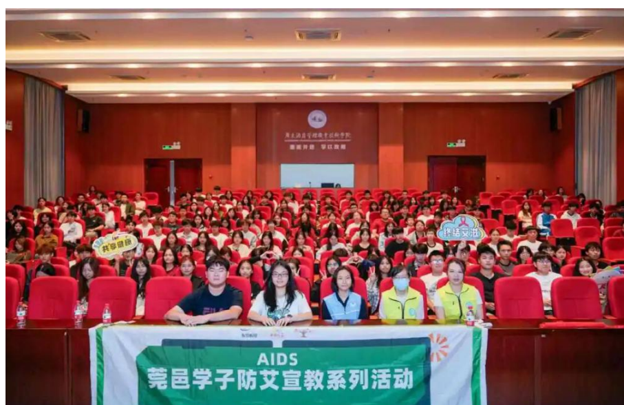
图 2.4-3 “同心抗艾，守护常在”预防艾滋病专题讲座活动

识。对外，深化校地合作，与厚街镇团委等地方单位共探合作新路径，为学生争取更多社会实践、志愿服务和就业见习机会；南门启用等学校发展的重要时刻，组织师生代表共同见证，增强其主人翁意识与荣誉感；支持学生参与“莞上”厂牌之星选拔等校外高水平竞赛（见图 2.4-4），并为获奖学子提供展示舞台，激发其追求卓越的動力。这些工作旨在打破校园边界，将社会资源引入校园，将学生推向更广阔的舞台，全方位助力其能力提升与视野拓展。