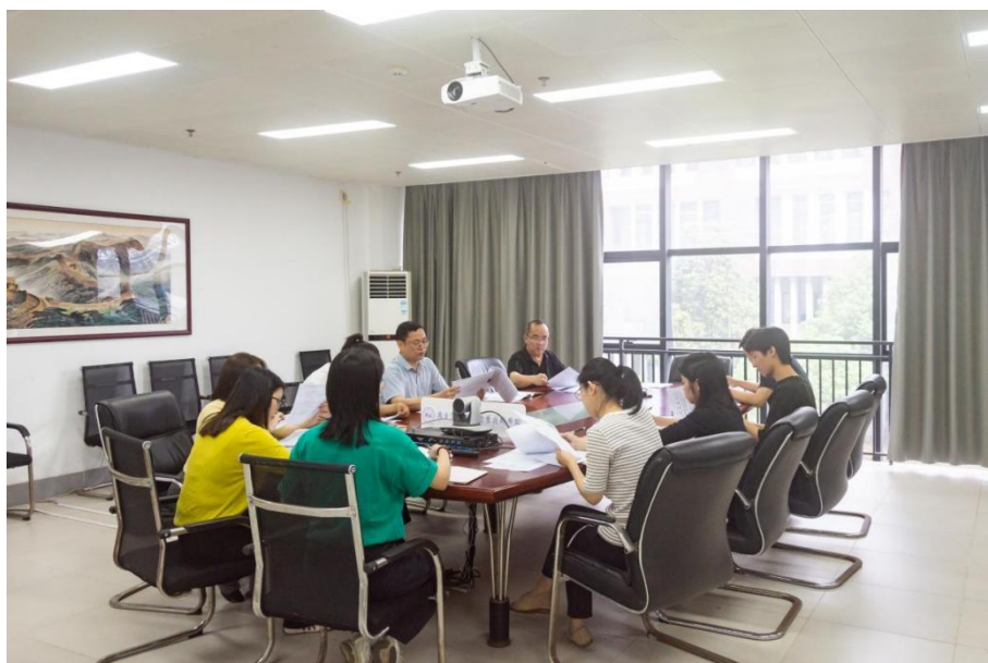
图 7.1-1 学校召开 2025 年度全口径全方位融入式帮扶工作专题会

做好宣传推广四点要求。会议对学校 2025 年度全口径全方位融入式帮扶工作进行部署，要求各相关部门紧密结合受援学校办学基础与发展需求，在学历提升、志愿服务、师资培养等关键领域靶向施策，制定切实可行的帮扶计划，确保帮扶工作取得实效。