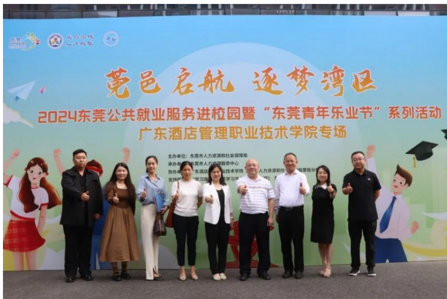
图 3.6-3 学校承接东莞公共就业服务进校园暨“东莞青年乐业节”系列活动

1.协助东莞市人力资源和社会保障局举行东莞公共就业服务进校园暨“东莞青年乐业节”，以“分享会+趣味职业指导+招聘会”的形式助力应届毕业生高质量就业，并得到了“学习强国”东莞学习平台、《东莞日报》、东莞+app 等媒体的大力支持（见图 3.6-3）。