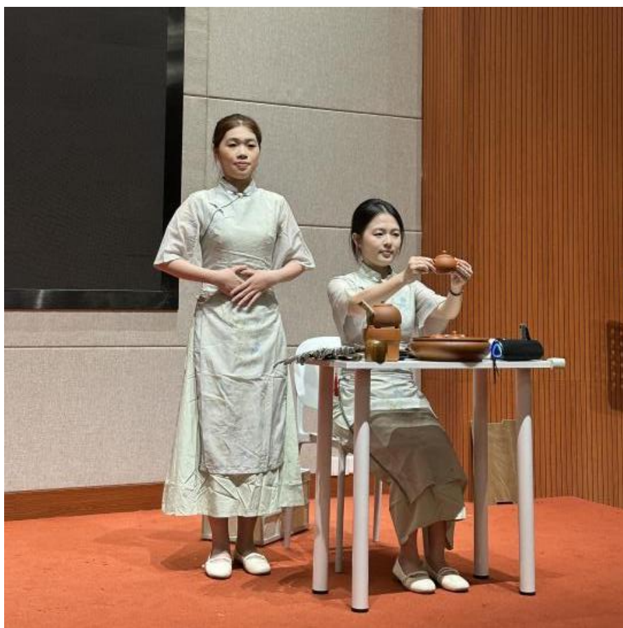
图 4.3-3 展示潮州工夫茶二十一式冲泡技法，讲解茶具与潮汕民俗文化

案例通过沉浸式跨学科学习，让学生体会地理与文化、旅游的关联，强化传统文化传承推广使命感与创新能力。