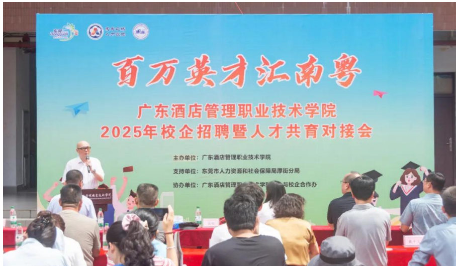
图 2.5.1-1 学校开展百万英才汇南粤活动