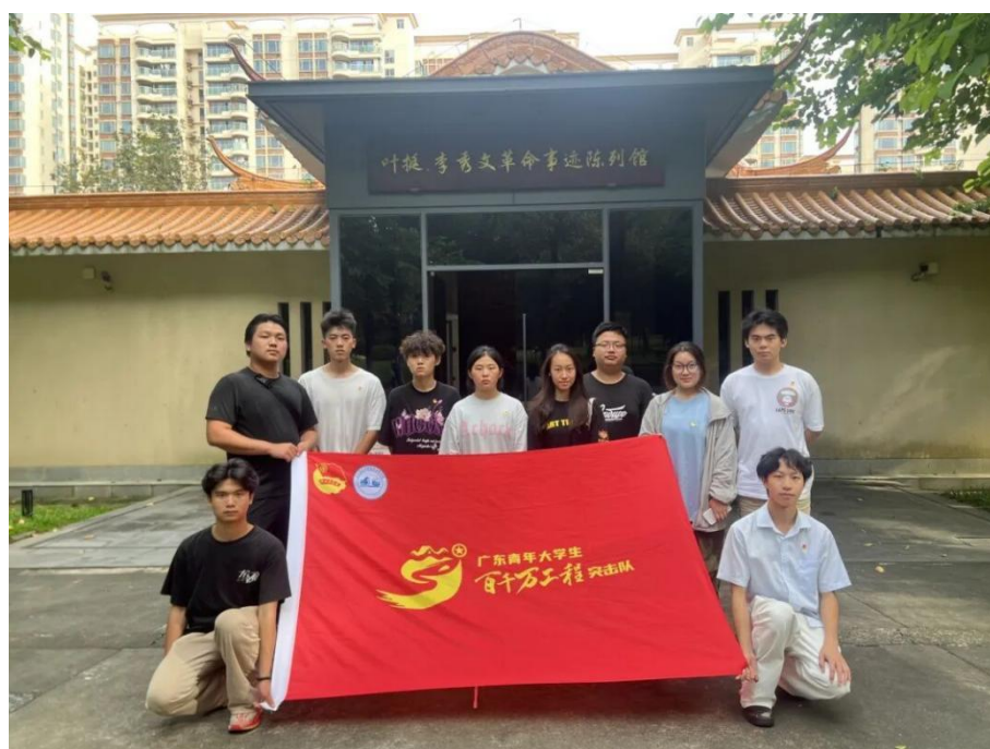
图 4.1-1 “百千万工程”燎原突击队学生参观革命烈士纪念馆活动

在虎门北栅陈超故居，队员们听着指导老师的讲解，了解了红色特工陈超在隐蔽战线上惊心动魄的工作经历。大家认真聆听指导老师的讲解，不时驻足凝望展品，在留言簿写下自己的感悟。此次参观活动，真切感受到了革命先辈的伟大精神，大家纷纷表示，要将在参观汲取的红色力量转化为学习和生活的动力，传承红色基因，努力成为担当民族复兴大任的时代新人，为实现中华民族伟大复兴的中国梦贡献自己的力量。