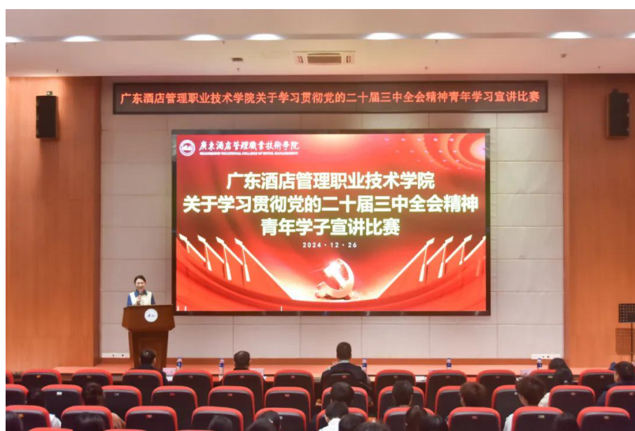
图 1.1-1 二十届三中全会精神宣讲比赛现场

案例启示，青年理论武装需找准“青春坐标”，兼顾政治性与创新性。学校将持续深化经验，优化宣讲队伍培养机制，推动理论与专业教育、社会实践融合，引导青年挺膺时代担当。