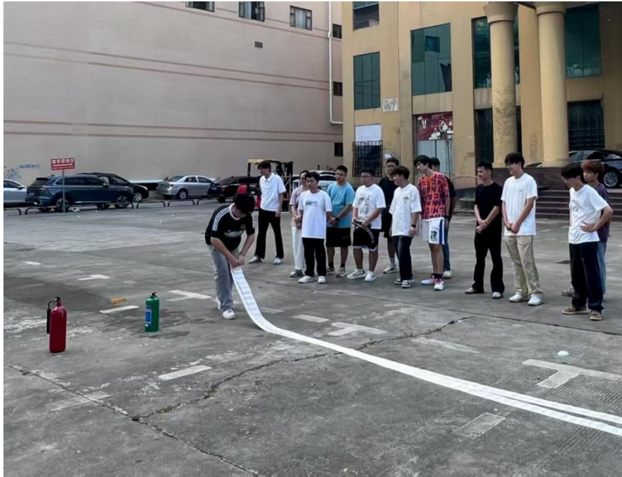
图 2.2.3-2 实训师生在实训酒店外开展集中授课实训工作场景(2)