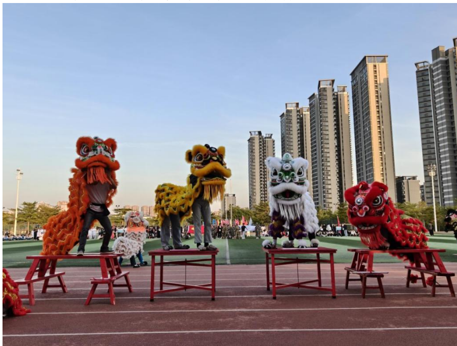
图 4.3-2 学校龙狮队在运动会开幕式的开场表演