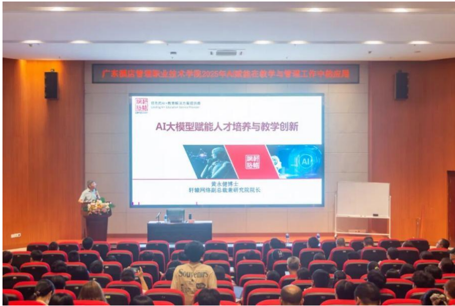
图 3.6-4 学校开展“AI大模型赋能人才培养与教学创新”专题讲座

2.特邀国内人工智能领域专家、轩辕网络副总裁黄永健博士开展“AI大模型赋能人才培养与教学创新”专题讲座，为学校对口帮扶学校——高州市镇江中心学校、石鼓第一中学及高州第一职业技术学院同步分享高校人工智能教育在当前职业教育教学创新中的赋能作用（见图 3.6-4）。