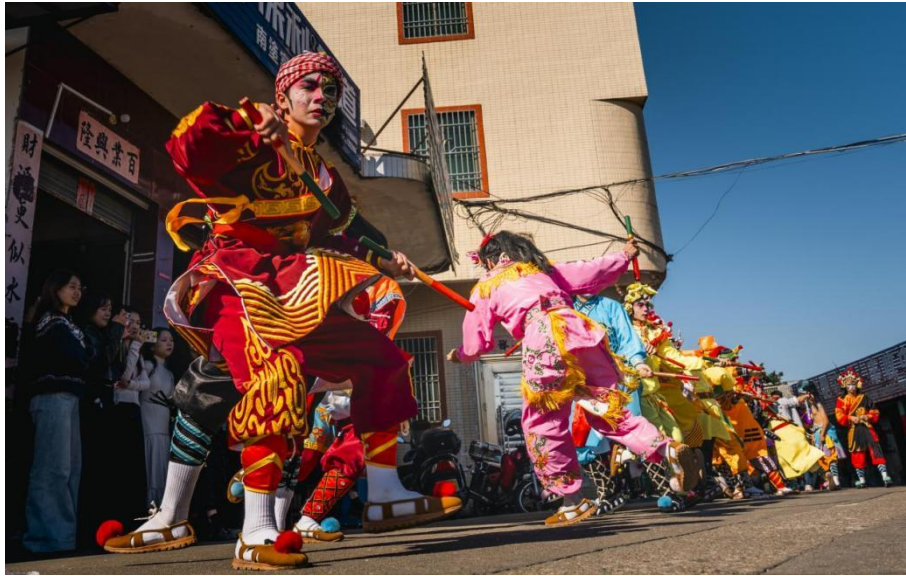
图 4.3-1 学校英歌舞队深入乡村弘扬传统文化