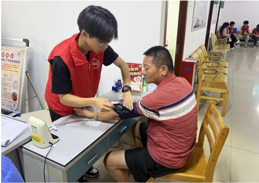
图 3.4-1 青禾突击队队员诊台协助测量血压