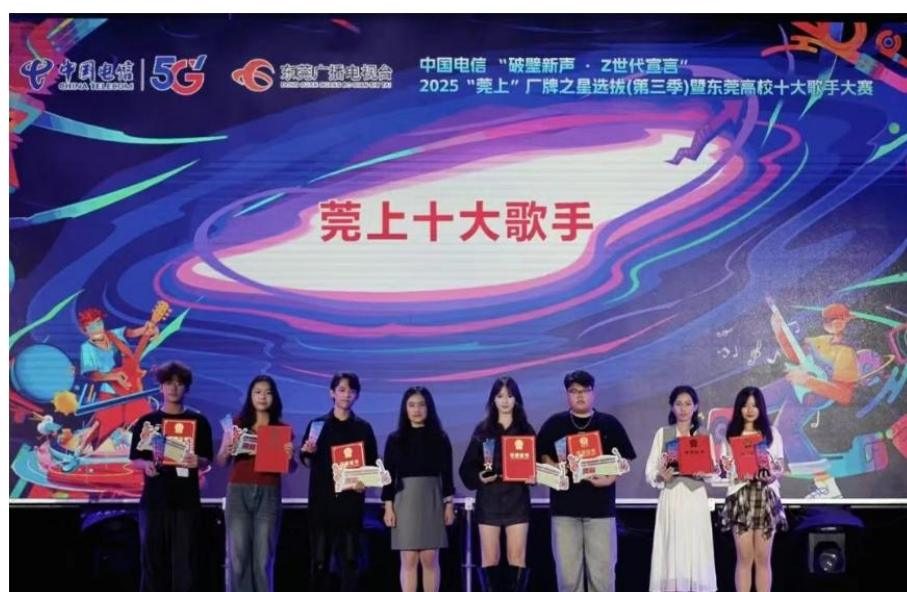
图 2.4-4 东莞市校园十大歌手颁奖仪式（右三为该校学生）